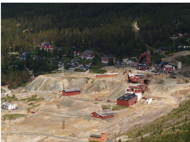
Gruveområdet på Verket, Folldal